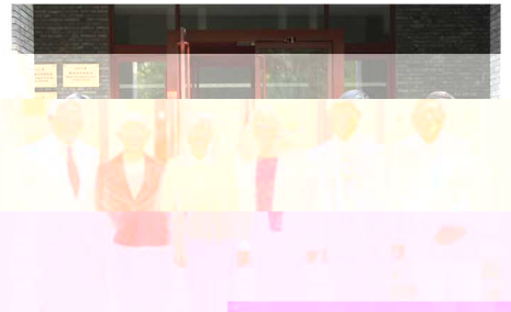
图1 斯坦福大学教育学院院长D. Everett一行在合影