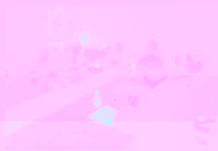
图2 斯坦福大学教育学院院长D. Everett一行在讨论